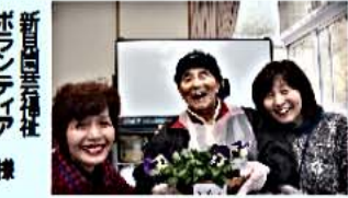
新見園芸福祉ボランティア 様